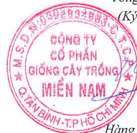
Hàng Phi Quang