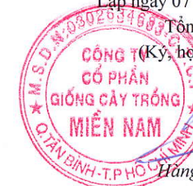
Hàng Phi Quang