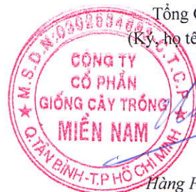
Hàng Phi Quang